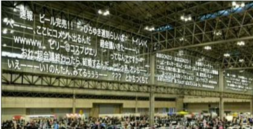
会場の壁にコメントが流れる