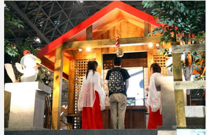
現地の来場者がネット視聴者に