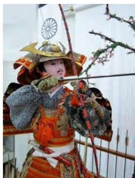
参考図版「弓射り武者人形」（「夢からくり一座」所蔵）