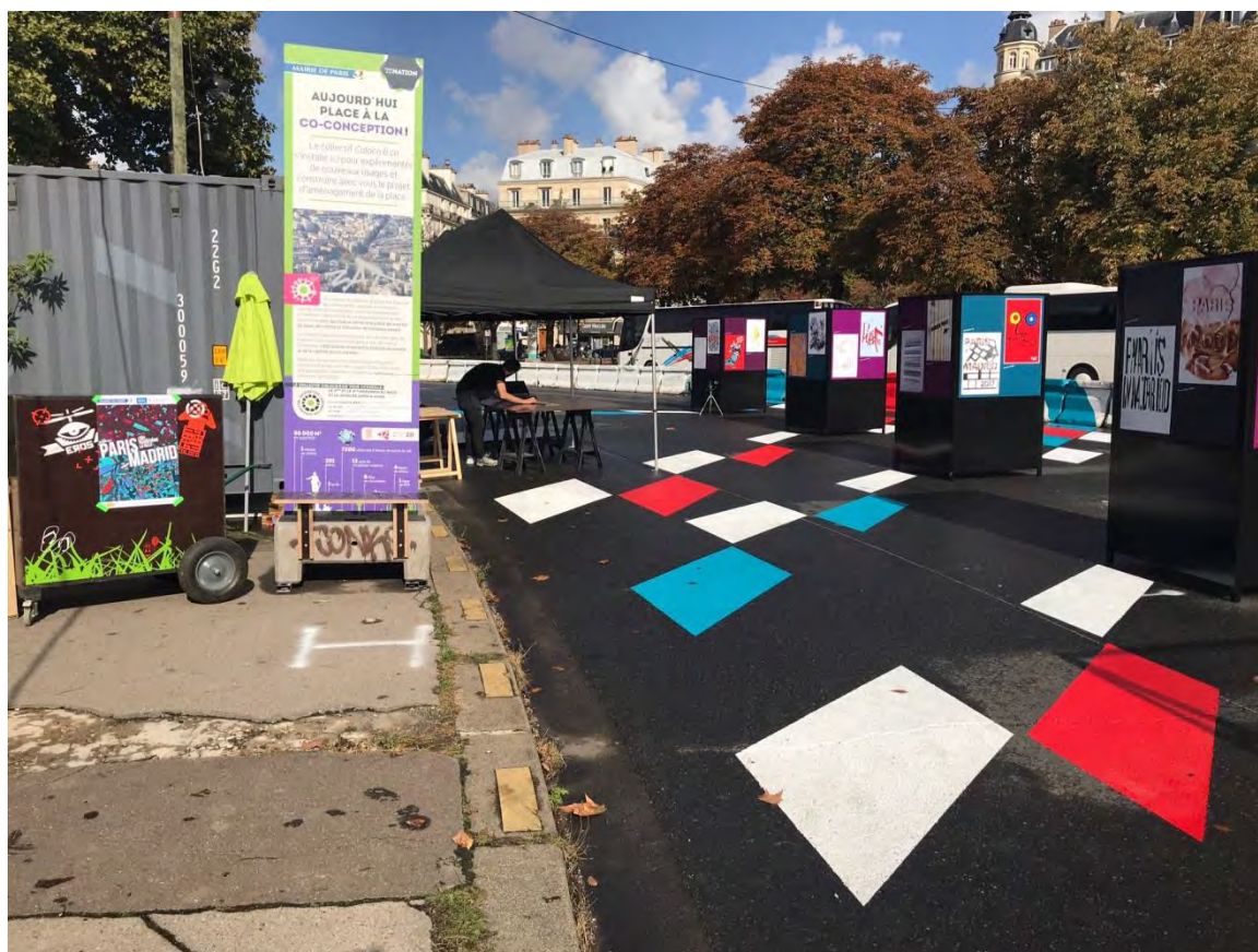
2017年のパリ市とスペイン・マドリド市のタンデムでのポスター展示風景

各校の優秀作品15点、合計30枚のポスターが選出され、都内各所で一緒に展示されます。 また、同時期にパリ市でもサンジャック塔の柵に同じ作品が展示されます。