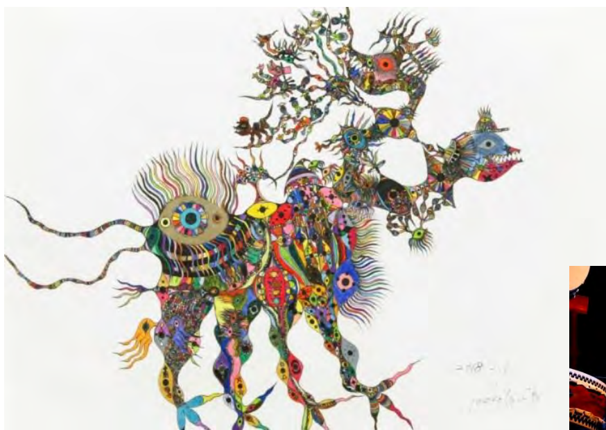
福井誠『双頭ドラゴウーゲ』(2018年)

今回の展覧会は、『アール・ブリュット ジャポネ』(2010-2011)に続く第2弾です。日本の作家52組の作品が今回のために特別にパリに集結します。また、展覧会との連携企画として、知的障害者によるプロの和太鼓集団「瑞宝太鼓」の公演もあります。ナント市では2019年2月23日(土)と24日(日)にフランス国立現代芸術センターリュウ・ユニックで、パリ市では2月27日(水)と28日(木)にパリ日本文化会館でパフォーマンスを披露します。