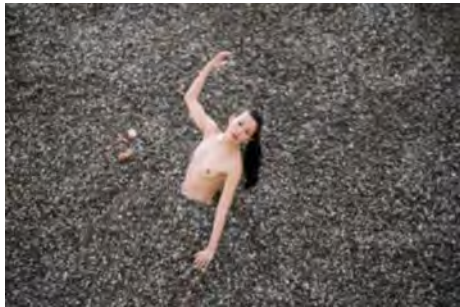
Robot, l'amour éternel

多重に反響するソロ作品。演出家・振付家のオレリアン・ボリー氏がダンサー・伊藤郁女氏のために制作した同作は、唯一無二で暗示的な空間を作り出します。実存的かつ感覚的で、人形劇やパフォーマンス、インスタレーション、影絵、そして日本の神話の中でも特に神道に関連する要素が交錯する魅惑的な作品となっています。