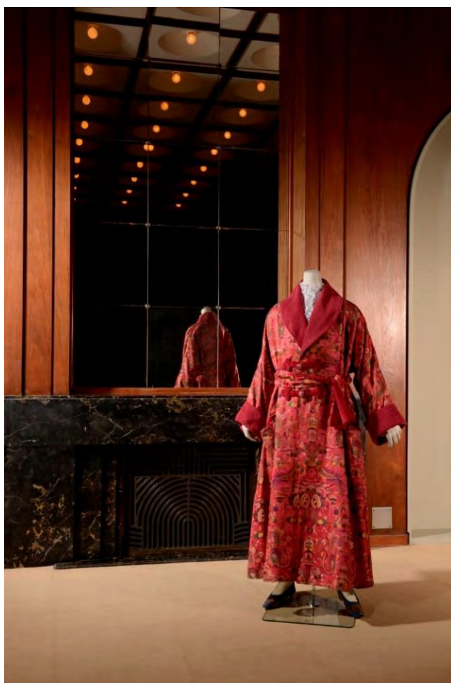
写真:ポール・ポワレ《中国風布地のローブ（ポール・ポワレ着用）》、個人蔵

会期中に同展覧会の日仏の研究者らによる講演会などの関連イベントも予定しています。