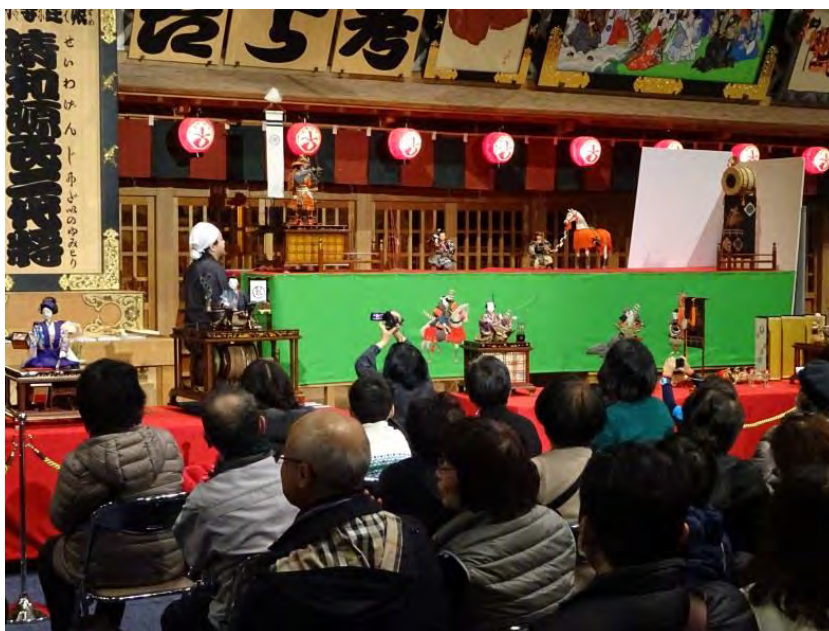
江戸東京博物館での「夢からくり一座」による実演風景

このたびのパリ公演は、貴重な「からくり人形」の実演をご覧ください。またとない機会となります。本公演により、現代まで脈々と息づいている、日本のものづくりの原点を紹介します。