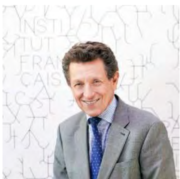
アンスティチュ・フランセ理事長 ピエール・ビュレール

伝統文化からデジタル・アート、舞台芸術、そして応用美術と幅広い分野を包括するこのプログラムは、パリと東京のそれぞれの独特の文化を通して両都市に共通する文化の豊かさを改めて強調するものとなっています。