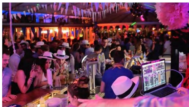
ローザ・ボヌール

クラブミュージック界のみならず、バレンシアガやジャン・ポール・ゴルチエのショーでも音楽を担当するなど、ファッション業界でも話題の Kiddy Smile（キディ・スマイル）をゲストに迎えます。パリのビュット・ショーモン公園やセーヌ川沿いに 3 店舗を展開するレストラン『ローザ・ボヌール』とコラボレーションします。