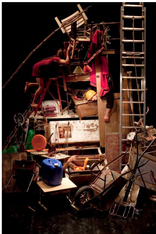
2014年公演『リメディア』より