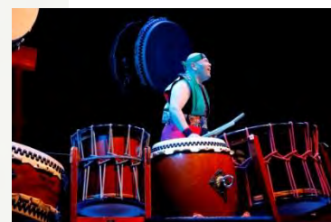
瑞宝太鼓