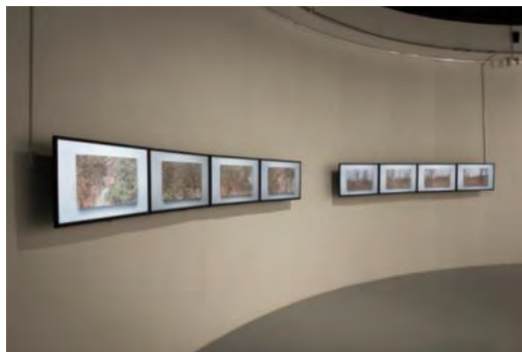
© Tracingsites - Collectif Couch © Vinciane Verguethen

ゲテ・リリックで展示されたインスタレーション作品『Tracing Sites』では、couchの2人はバーチャルの世界と物理的な空間のハイブリッド化を試みています。鑑賞者の受動的な姿勢に疑問を投げかけ、自発的に動き、日常生活で出会う経済的、政治的、歴史的なテーマに積極的に関わることを促す作品です。