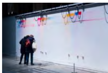
So Kanno et yang02 - Semi-Senseless Drawing Modules