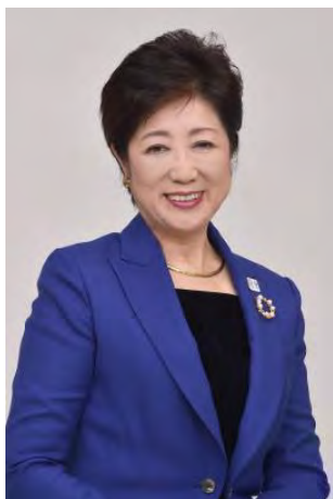
東京都知事 小池 百合子

東京都とパリ市は、友好都市となって以来 36 年間、スポーツ、環境、文化など幅広い交流を行ってきました。