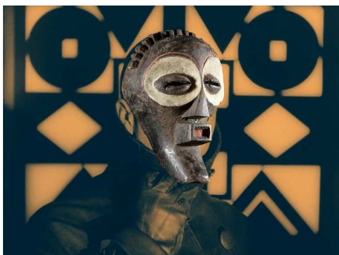
ムニール・ファトゥミ《ヒューマン・ファクター》2018年