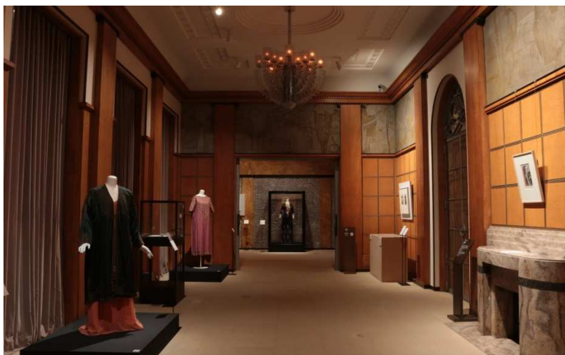
本館（旧朝香宮邸）における展示