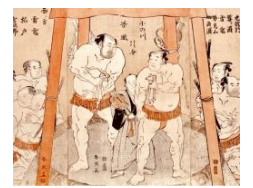
勝川春英/画《小野川 谷風 引分の図》(部分)1791(寛政3)年頃 東京都江戸東京博物館蔵