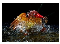
嶋田忠 シリーズ《アカシヨウビン》より 1981～87年 東京都写真美術館蔵