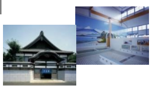
江戸東京たてもの園 復元建造物 子宝湯