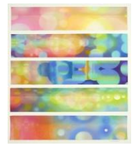
曾谷朝絵《Chords》2018年 バステル、紙

トーキョーアートアンドスペース レジデンス2019 成果発表展 予兆の輪郭 第1期 2019年4月13日～5月19日 第2期 2019年6月1日～7月7日