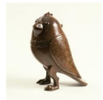
香取秀真《鳩香炉》 千葉県立美術館蔵