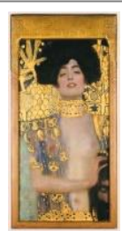
グスタフ・クリムト 《ユディット1》1901年 ベルヴェデーレ宮 オーストリア絵画館