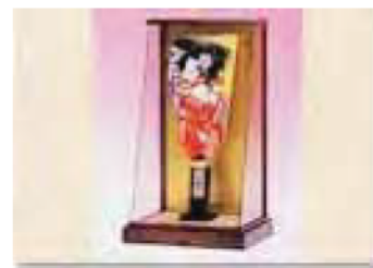
江戸押絵羽子板 (えどおしえはごいた)