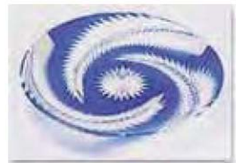
江戸切子 (えどきりこ)