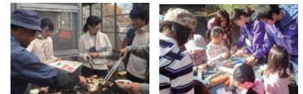
遊学会の皆さんと活動後のBBQ交流。