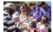
間伐した竹を使い竹笛づくり。