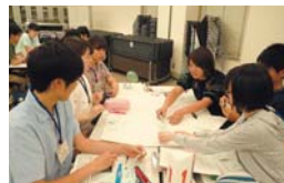
事前学習グループワークの様子

域のプログラムが共通して行い、ボランティアとは何かを学びます。またなぜこのプログラムに参加したのか、という自分自身の動機を明確にする作業を行います。この学習を通じて、学生はボランティア活動の基本概念でもある「自発性」「社会性」「無償性」について考えます。個々の動機とボランティアプログラムの社会性などを合わせて考えることで、学生は自分と社会の接点について考えるようになります。