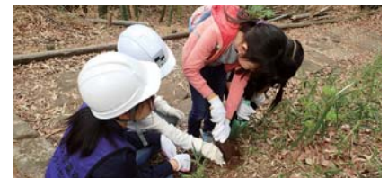
小学生たちとのタケノコ掘り体験

活動後には小学生から「見つけるのが大変だったけど楽しかった」「タケノコがおいしかった」という感想も。ボランティアが初体験だった学生からは「大学の敷地内にこんな自然があることを知らなかった」「子供たちとの交流が楽しく、また参加したい」という声が聞かれ、自然の中で交流が深まり、大学と地域とが連携することの良さや、ボランティア活動のやりがいを感じた1日となりました。