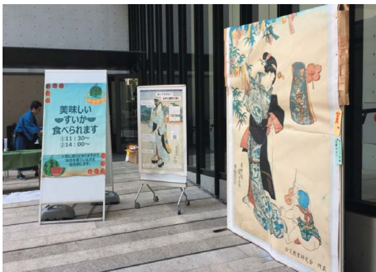
浮世絵の前で写真を撮ることで、浮世絵の世界を疑似体験する。