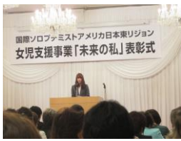
国際ソロプチミストアメリカ日本東リジョン 女兒支援事業「未来の私」表彰式