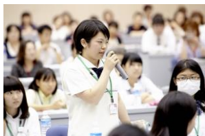
第 9 回日本東リジョン ユース・フォーラム