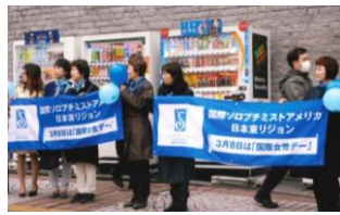
ソロプチミスト キャンペーン