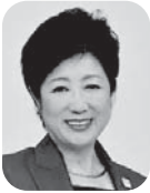
東京都知事 小池 百合子