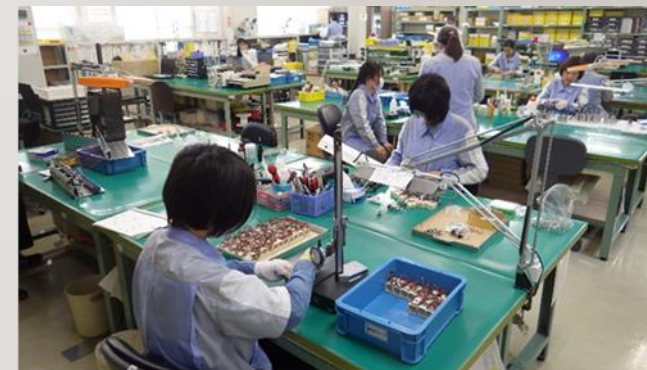
毎朝、全員掃除できれいな職場づくり