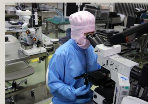
女性は仕事が丁寧な方が多い