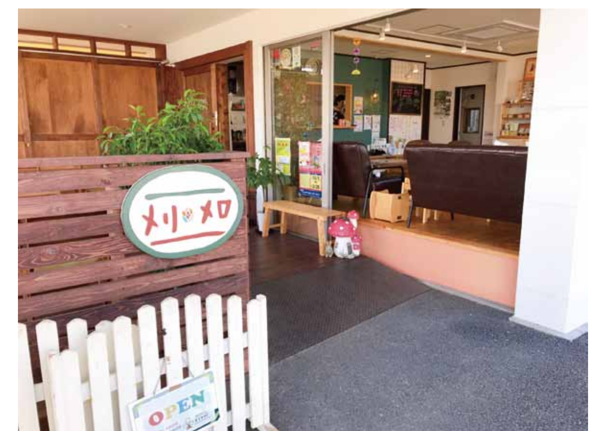
小作駅前のカフェ