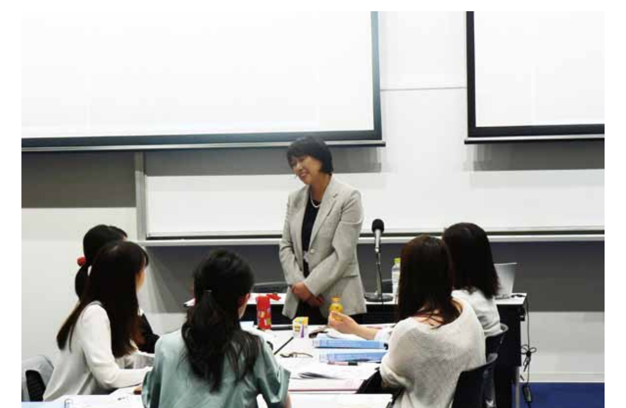
キャリアカレッジの様子