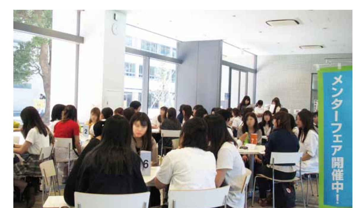
メンターフェアの様子