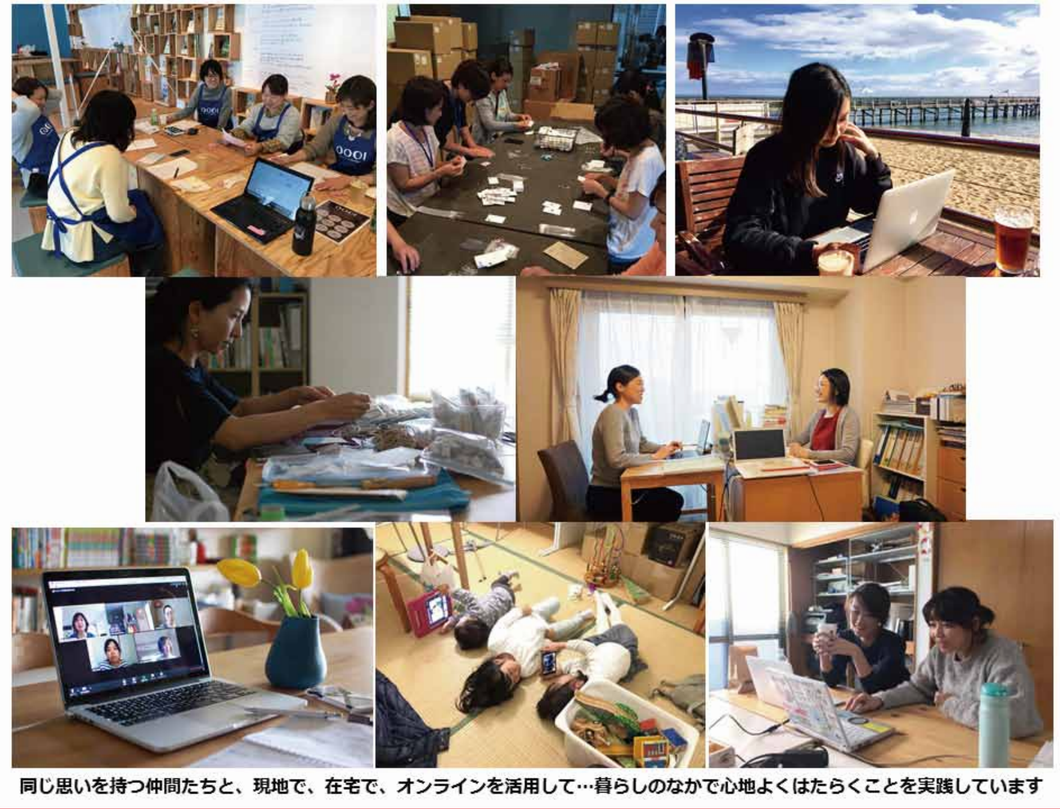
同じ思いを持つ仲間たちと、現地で、在宅で、オンラインを活用して…暮らしのなかで心地よくはたらくことを実践しています