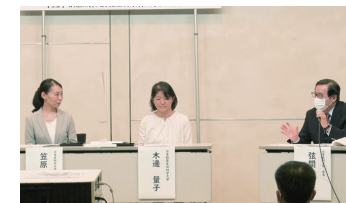
～ダイバーシティ研究環境実現に向けて～ キックオフシンポジウム パネルディスカッション