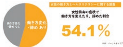
女性の働き方とヘルスリテラシーに関する調査