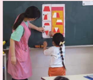
子供の興味・関心を引き出す 知育教育