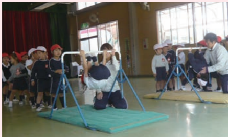
体操で健やかな身体づくり