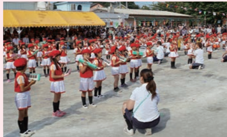
合奏で豊かな感性を育む