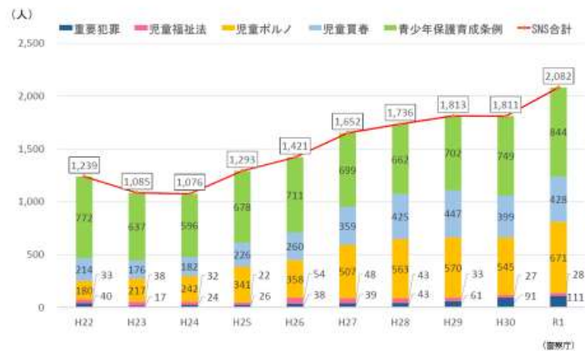
SNSに起因する青少年の被害者数の推移（全国）

(東京都 家庭等における青少年の携帯電話・スマートフォン等の利用等に関する調査書 (令和2年1月調査))