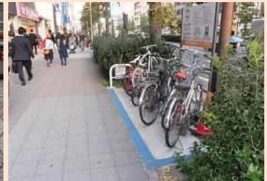
町会の働きかけで 設置された駐輪場

上記取組により、新宿駅西口周辺の放置自転車台数減少に貢献！ 10年間で 放置自転車台数は1/10以下に！