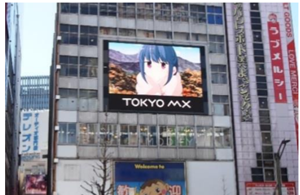
大型ビジョン（秋葉原駅周辺）