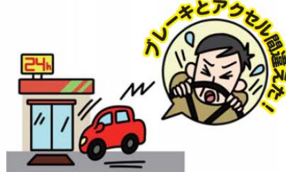
ペダル踏み間違え時の加速抑制