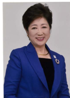
東京都知事 小池 百合子

悲惨な交通事故を無くして、誰もが安全にいきいき生活できる都市を一緒に実現していきましょう。