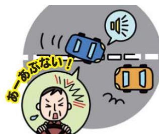
車線はみだし警報