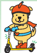
安全安心を推進するマスコットキャラクター みまもりいぬ