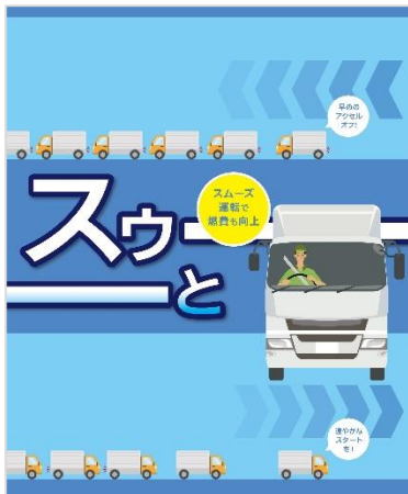
配送ドライバー向け