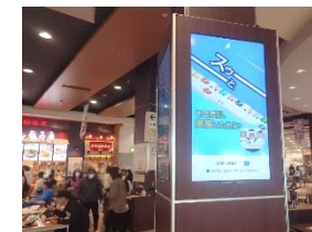
イオンモールむさし村山での上映の様子