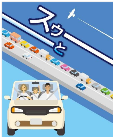
ファミリードライバー向け