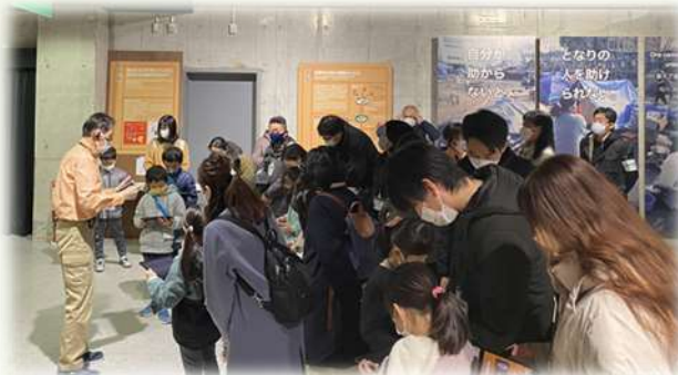
▲防災体験学習ツアー