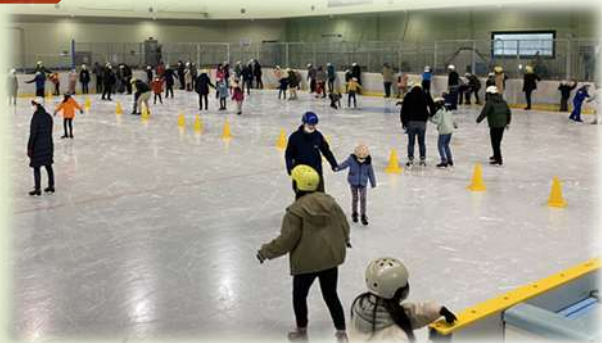
▲早朝親子スケートの集い