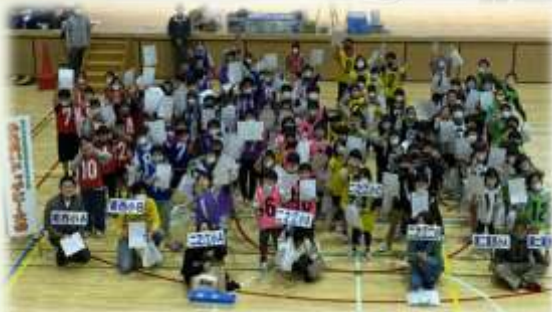
▲ふれあいドッチビー大会