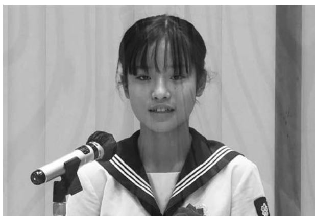
知事賞受賞者インタビュー