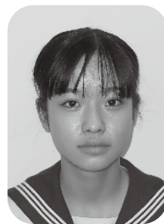
大田区立大森第八中学校 三年