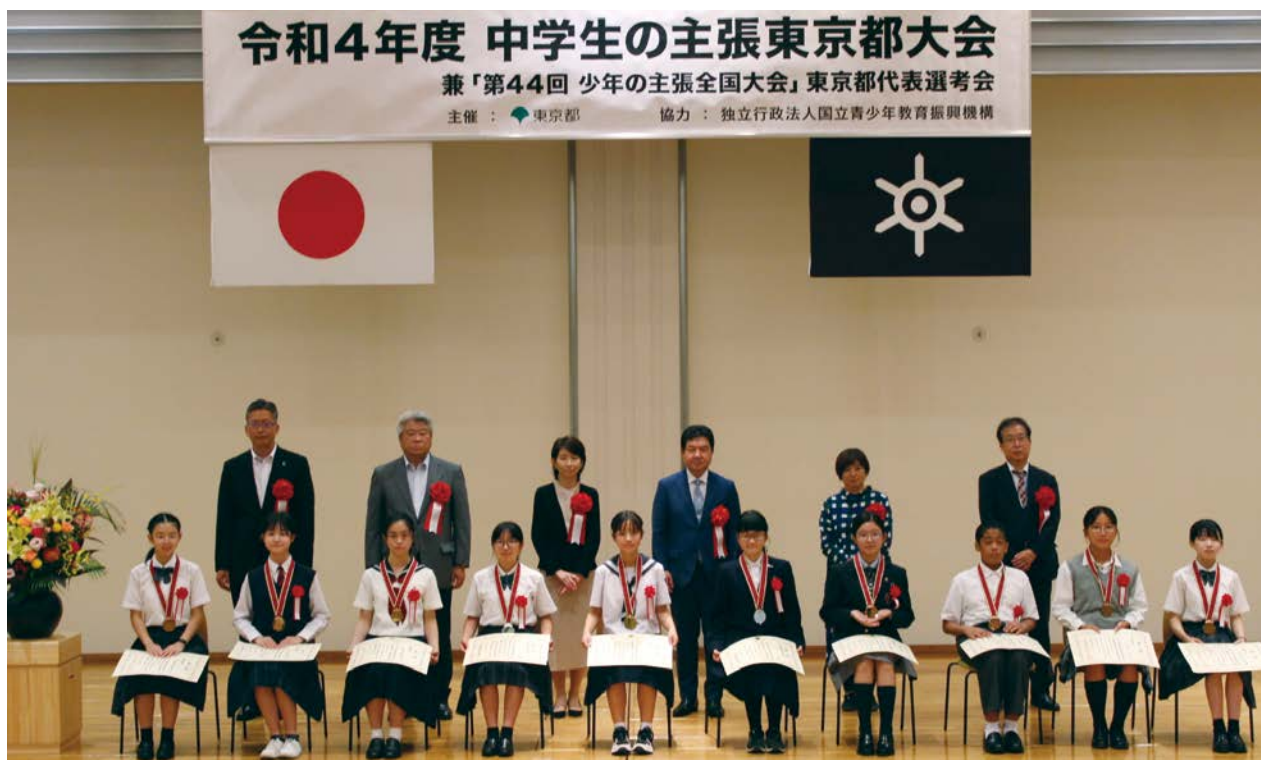
発表者と審査員の皆さん