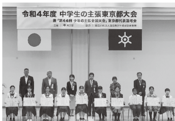
受賞おめでとうございます