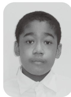
立正大学付属立正中学校 一年