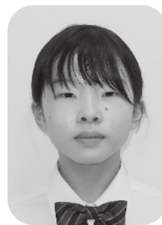
東京都立武蔵高等学校附属中学校 三年