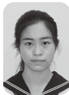
國學院大學久我山中学校 三年