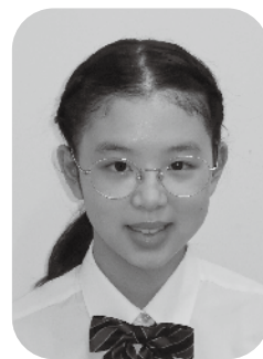
東京都立武蔵高等学校附属中学校 三年