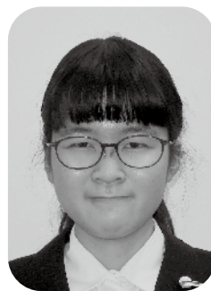
東京学芸大学附属世田谷中学校 三年