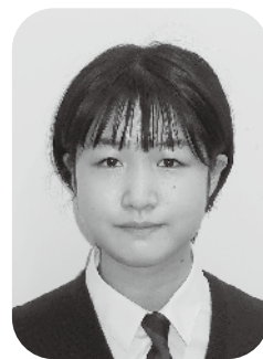
立川市立立川第二中学校 三年