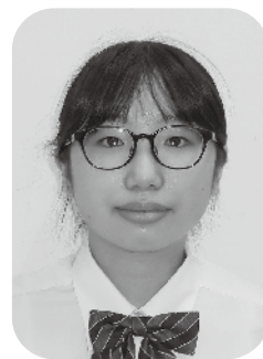
東京都立武蔵高等学校附属中学校 三年