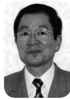
東京女子体育大学名誉教授