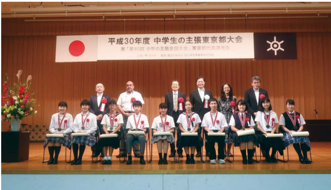
発表者のみなさん