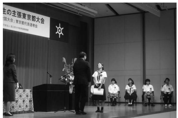
受賞おめでとうございます