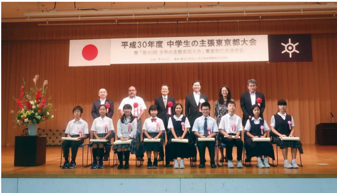
努力賞受賞者のみなさん