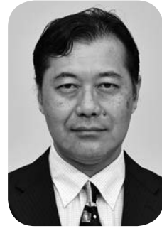
東京都青少年・治安対策本部長