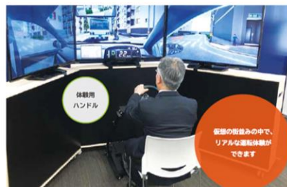
危険予測シミュレータ自動車編