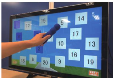
運動能力診断ソフト（セーフティタッチ）