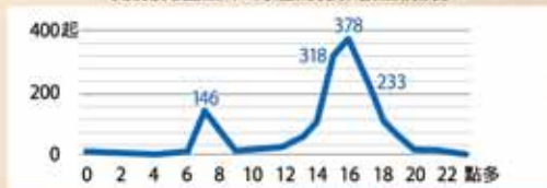
《侵犯兒童生命·身體的犯罪發生情況》